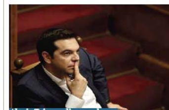
Alexis Tsipras diz que alguns