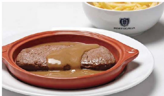
Há bifés e bifés. Estes são gratuitos