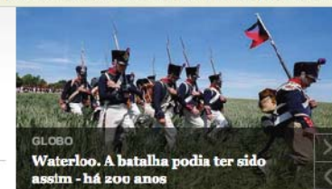
GLOBO Waterloo. A batalha podia ter sido assim - há 200 anos