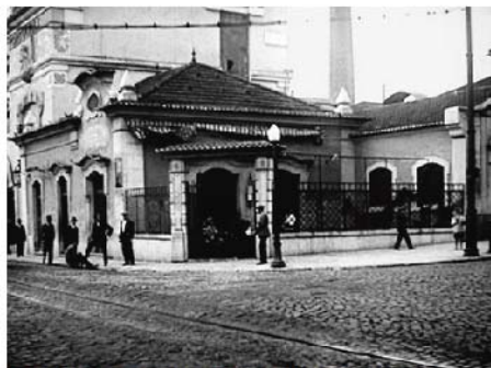
Quando a cervejaria Portuguesa abriu as portas na Almirante Reis, em Lisboa, destinava-se apenas a servir cerveja e acompanhá-la aos pratos que esperavam à porta da fábrica e hoje inclui o menu dos Leões

por Inês Banha 09 junho 2015 6 comentários