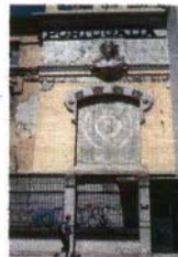
Fachada é o que resta da antiga fábrica de cerveja